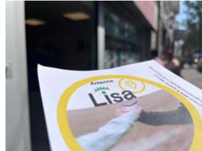
Opening van LISA Forest

Dankzij de jaarlijkse projectoproep bij de verenigingssector ondersteunt safe.brussels ook de realisatie van meerdere projecten die in de lijn liggen van het Globaal Veiligheids- en Preventieplan. Voor de projectoproep 2021 heeft safe.brussels een totaal van 54 projecten ondersteunt van verschillende vzw's zoals Atmosphères Amo, JES of CIDJ & Inforjeunes die tot doel hadden te dialoog (over rechten en plichten) en de interactie tussen politie en jongeren te verbeteren.