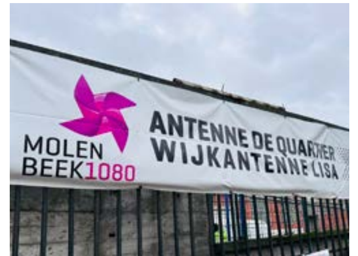
Opening van LISA Molenbeek